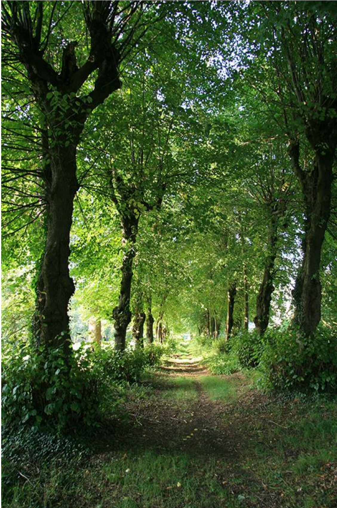
1 e prijs fotowedstrijd Kostbaar Salland 2009, Fred Groeneveld