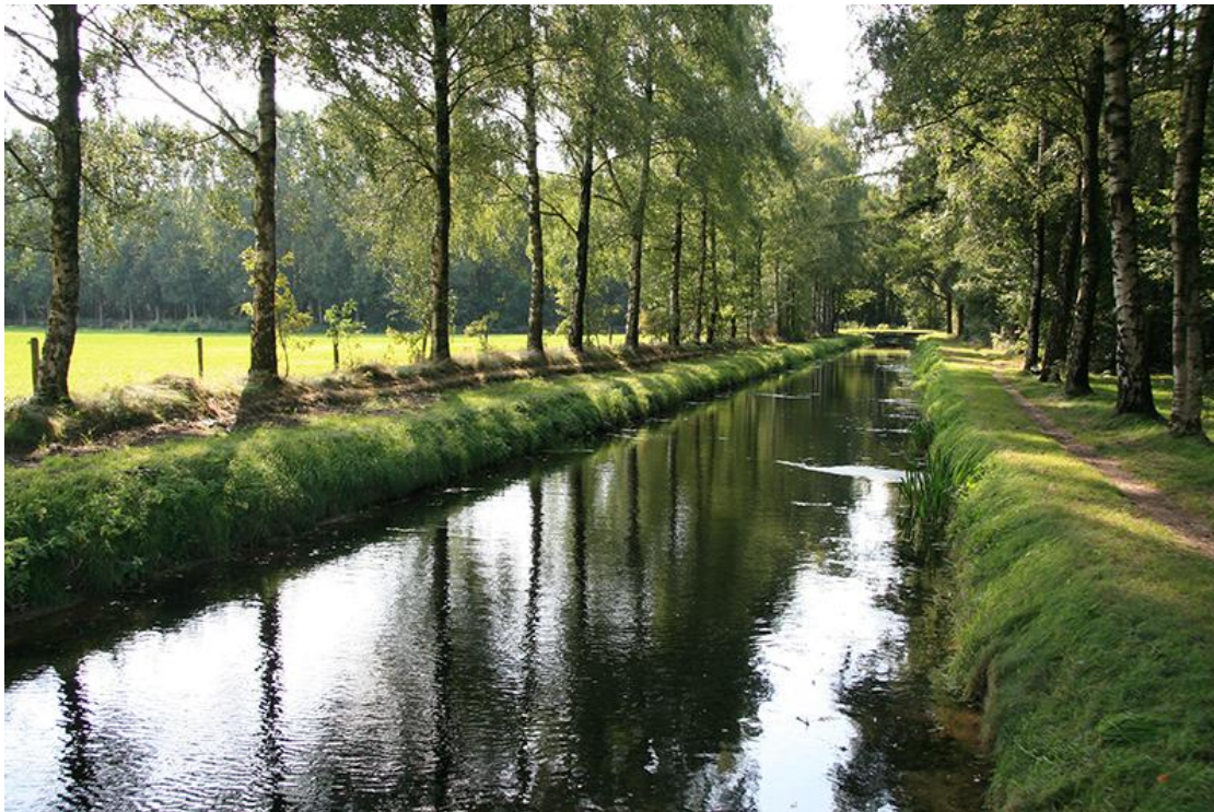
3 e prijs fotowedstrijd Kostbaar Salland 2009, Fred Groeneveld